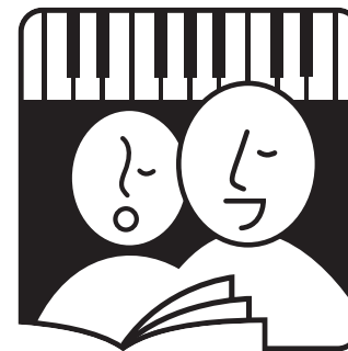
Muziekgravure: SCALA, Driebergen